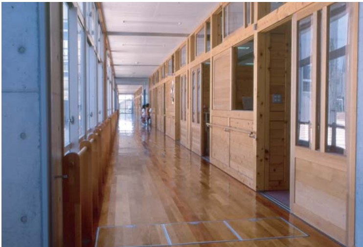
図6 木製（ヒノキ）パネルの続く廊下