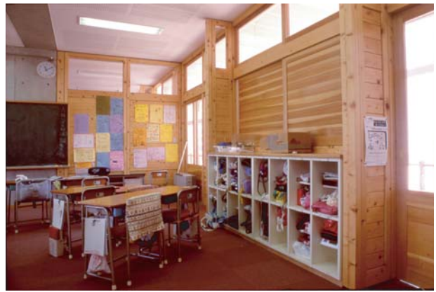
図3 教室：間仕切壁は木製（ヒノキ）パネルで構成される