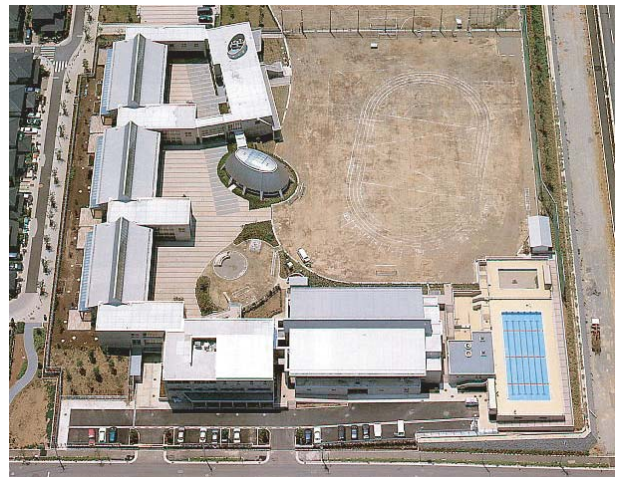
図1 みなみ野小学校全景